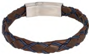
BR229034 € 29.95