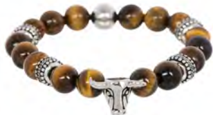
BR229044 € 29.95