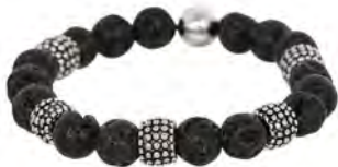
BR229043 € 29.95