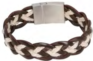
BR229025 € 29.95